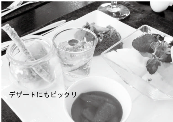
デザートにもビックリ